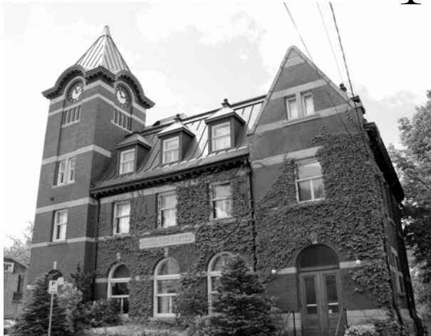
Musée de l'Hôtel des Postes